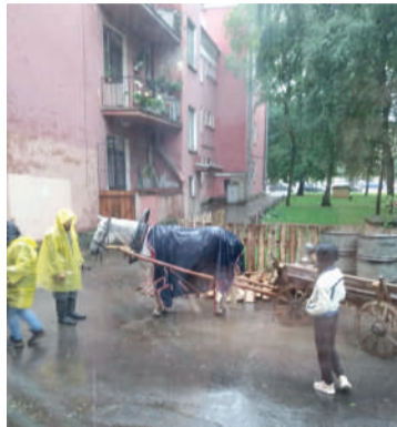
На снимках: актриса Валентина Васильевна СЕРОВА в фильме «Сердца четырёх» (1941 г.); съёмки фильма «Любовь Советского Союза» на Тракторной улице.

впряжённую в повозку для торговли керосином.