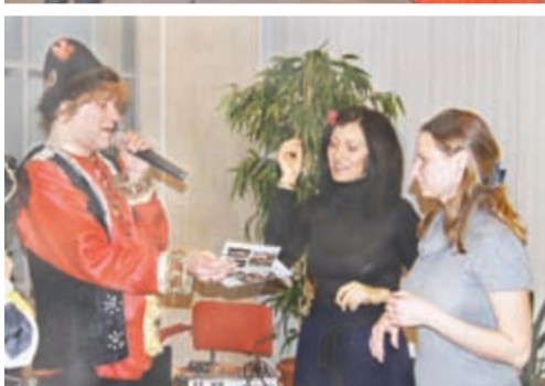
Концерт для мам: выступают учащиеся СШ №608 и профессиональные артисты; мамы участвуют в конкурсах.

Международный женский день давно утратил свою политическую окраску, и поздравления с этим праздником с удовольствием принимают все представительницы прекрасного пола. А вот в День матери принято поздравлять тех женщин, кто уже подарил жизнь новому человеку или готовится к материнству. День матери существует во многих странах, но везде приходится на разные даты. В России этот праздник отмечается с 1998 года, в последнее воскресенье осени. Несмотря на то, что праздник возник столь недавно, идея его оказалась очень близка всем людям: подчеркнуть значение в нашей жизни главного человека — Матери.