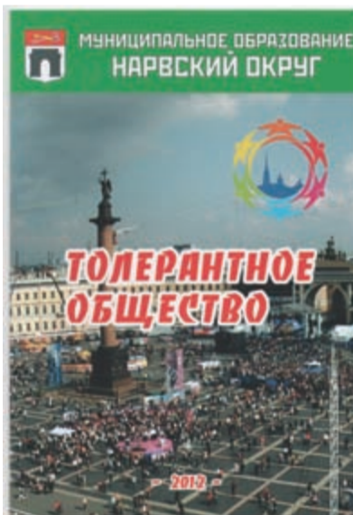
Брошюра, изданная Муниципальным советом Нарвского округа. Её можно получить на ул. Оборонной, д.18.

ках, торговли вне магазинов. Большая часть трудовых мигрантов, не имеющих достаточной профессиональной подготовки, работает в сфере услуг, в строительстве, розничной торговле, а также по найму у физических лиц. Из 164 тысяч разрешений на работу, оформленных иностранным гражданам за 10 месяцев года в Санкт-Петербурге, по квалифицированным специальностям выдано менее полутора тысяч.