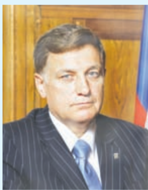
Вячеслав МАКАРОВ, Председатель Законодательного Собрания Санкт-Петербурга, Секретарь регионального отделения партии «ЕДИНАЯ РОССИЯ»