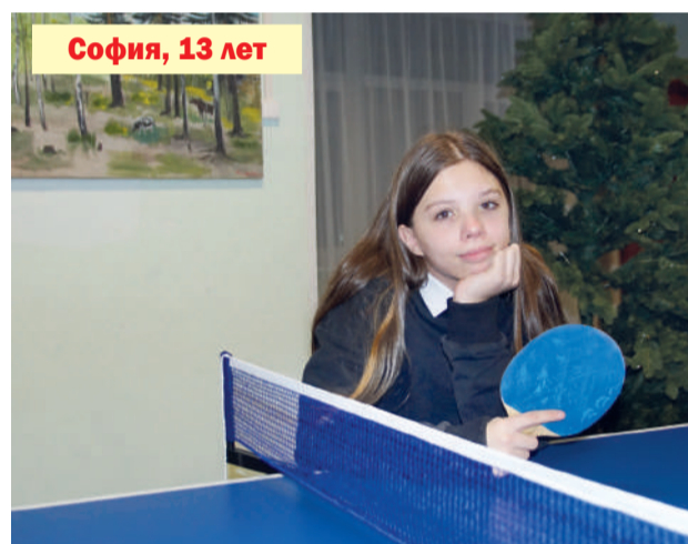
София, 13 лет

Возможные формы устройства: попечительство, приёмная семья, удочерение.