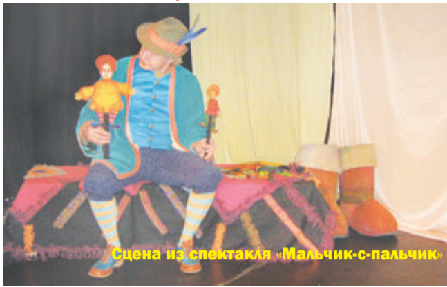
Сцена из спектакля «Мальчик-с-пальчик»