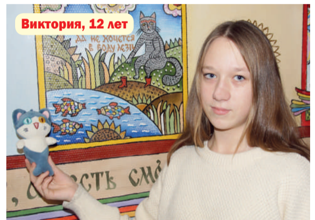
Виктория, 12 лет

Возможные формы устройства: опека, приёмная семья, усыновление.